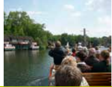
Dampferfahrt in Wusterhausen