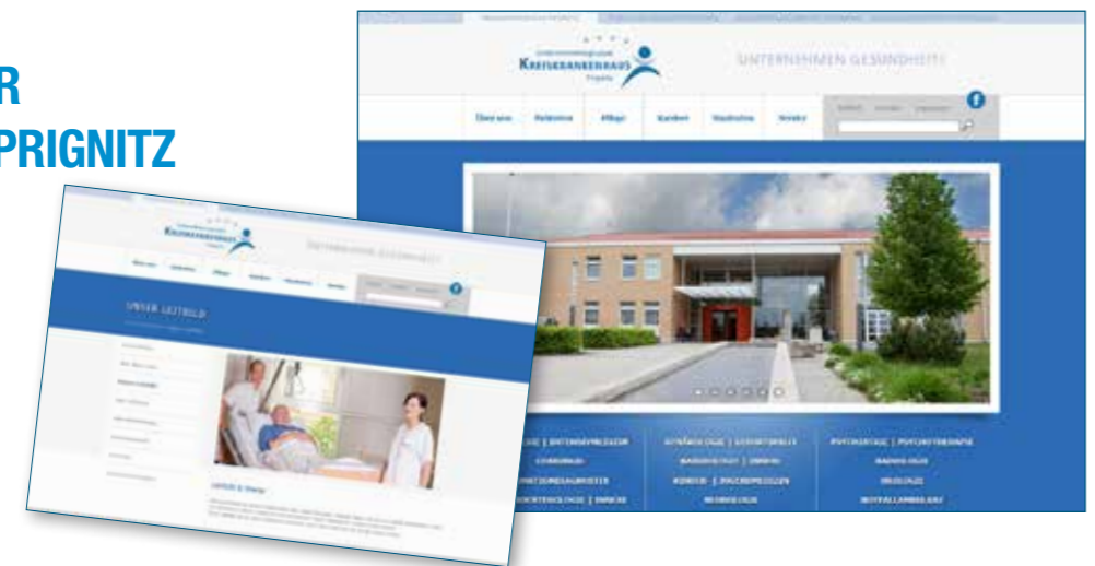
rosengrün kommunikation Junckerstraße 10 | 16816 Neuruppin | www.rosengruen.de

Nach der Erstumsetzung im Jahr 2010 hat rosengrün kommunikation den Internetauftritt des Kreiskrankenhauses Prignitz neu erstellt. Das umfangreiche Webportal informiert über die einzelnen Kliniken des Hauses und hält für die Patienten vielfältige wichtige Informationen bereit. Ein Körperatlas ermöglicht das spielerische Finden einer Klinik. Das Projekt wurde Anfang 2014 begonnen. Die neue Webseite geht im August online, die Umsetzung der mobilen Version läuft derzeit. www.krankenhaus-prignitz.de