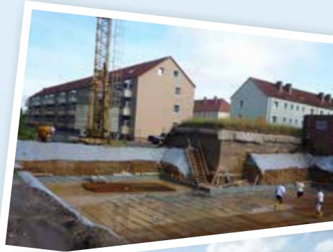
Ruppiner Bauring Kränzliner Str. 32 a | 16816 Neuruppin www.ruppiner-bauring.de

Das Bauvorhaben „BHKW am Wasserturm“ begann mehr als feucht. Nachdem die Baugrube fertig war, kam ein heftiger Regenschauer und dazu ein Wassereinbruch von einem alten Rohr. Trotz der Wiederungen ging der Bau gut voran. Die Wände sind angelegt und die Decke ist verlegt. Das Schornsteinfundament ist betoniert und der Bau befindet sich wieder im Zeitplan. Der Bauherr, die Stadtwerke Neuruppin, sind mit dem Baufortschritt sehr zufrieden.