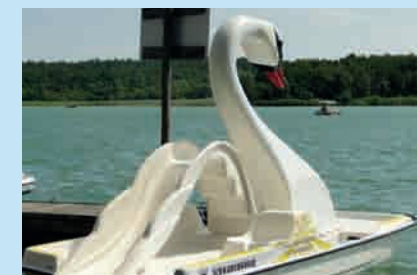
Hotel Gutenmorgen Zur Beckersmühle 103 | 16837 Dorf Zechlin www.hotel-gutenmorgen.de

Den Großen Zechliner See können die Besucher des Hotels seit diesem Sommer auch mit dem neuen Gutenmorgen-Schwan erkunden. Ein Spaß für die ganze Familie!